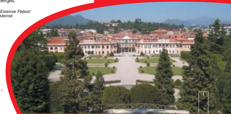
1. Varese: Estense Palast/ Palais Estense

C'est une vision vraiment incomparable celle qui apparaît au voyageur qui arrive à Varèse soit par la route soit par chemin de fer. Dans un harmonieux milieu naturel, la ville s'étend sous un ciel qui semble infini, entre la vaste étendue de vert, les eaux calmes du lac d'origine glaciale et la couronne des Alpes et des Préalpes avec le Mont Rose, diadème parfaitement enchâssé. Sur tout l'ensemble du paysage de la province de Varèse se détachent, d'un côté l'originale silhouette du clocher de St. Victor et de l'autre la file de chapelles du Sacro Monte ainsi que son petit hameau de maisons retranchées sur le sommet de la colline, comme modèles architecturaux déterminants et caractéristiques. Le vert émeraude, note déterminante de la nature environnante, décliné dans la variété de parcs et de jardins, se fond admirablement avec le tissu urbain, avec les palais et les villas, témoins discrets de l'attraction que ce lieu exerce depuis toujours sur les vacanciers et les touristes. Une promenade dans le centre historique, à la découverte des coins les plus suggestifs, vous donnera la possibilité de passer de plaisants moments. C'est seulement en arrivant au sommet du Sacro Monte que vous pourrez vraiment apprécier le coup d'œil enchanteur partagé entre l'aspect efficace de la ville et la contemplation de la montagne sacrée.