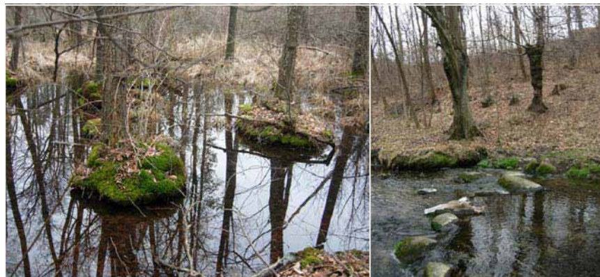
06 ATTRAVERSAMENTO PRESSO MOLINO COLOMBERA