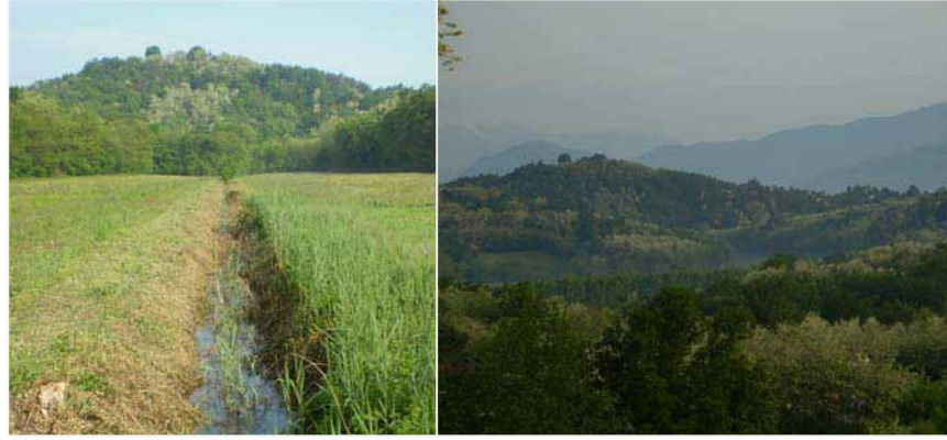
04 LUNGO STRONA