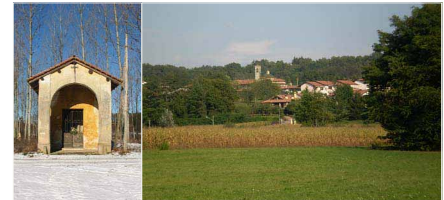
13 MONTE TOROMONTE