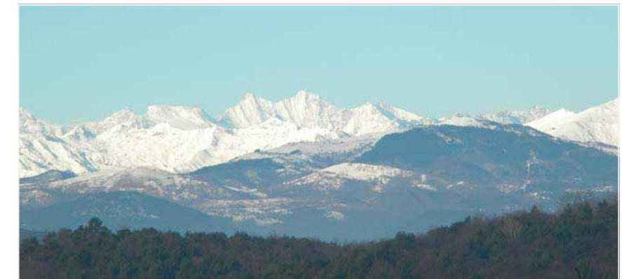
14 CROSIO DELLA VALLE