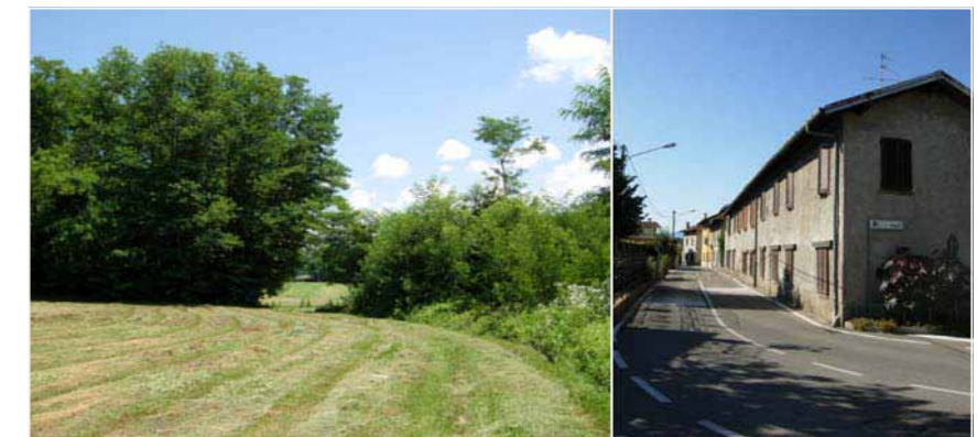
15 PIANA VEGONNO