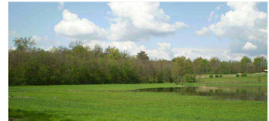
10 CRUGNOLA_SOTTOPASSO FERROVIARIO