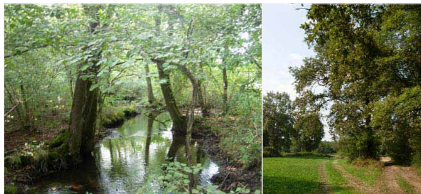
08 CENTENATE_CASCINA RISARA