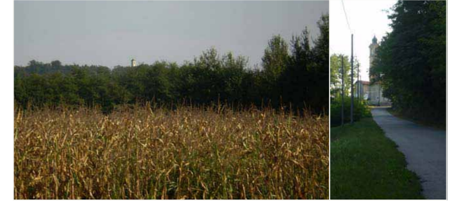
12 SAN GAETANO_PIANA MONTONATE