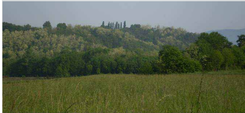
03 ATTRAVERSAMENTO FOSCO CARONINO_VISTA BOGGIARELLA