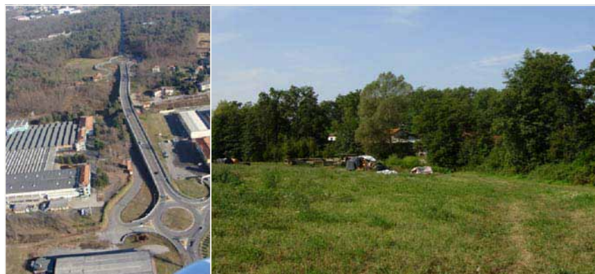
07 VALLE BAGNOLI