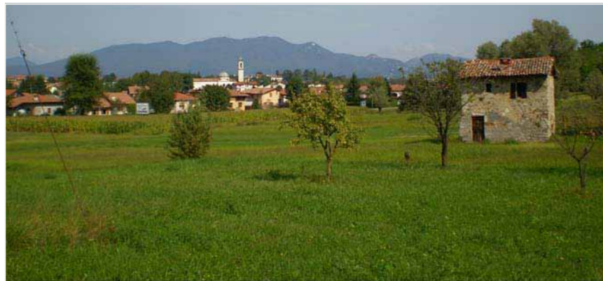
02 VEDUTA SULLA COLLINA CHE DOMINA DAVERIO VERSO BODIO LOMNAGO