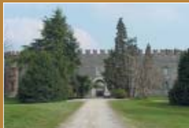
Castello di Caidate (Sumirago)