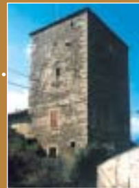
Torre di Pino Lago Maggiore