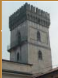
Torre di Bodio Lomnago