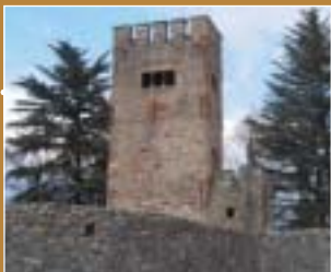
Castello di Monte Castello a Laveno Mombello

Schloss Castelnuovate in Vizzola Ticino – Ruine / Le château de Castelnuovate à Vizzola Ticino - ruines