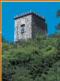
Torre Imperiale di Maccagno Inferiore

Turm von Biumo in Varese / La Tour des Biumi à Biumo (Varèse)