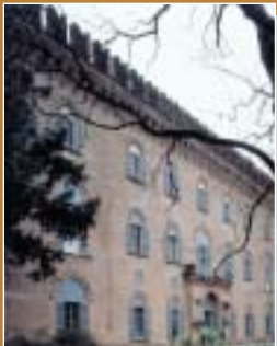
Castello Visconti di Cassano Magnago