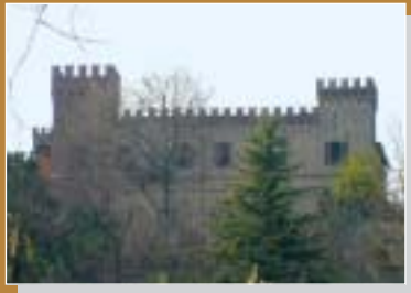
Castello di Crenna (Gallarate)