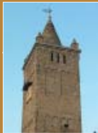
Torre di Gazzada Schianno