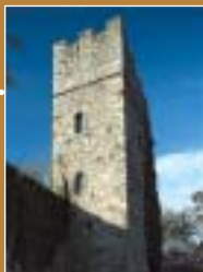
Rocca di Orino